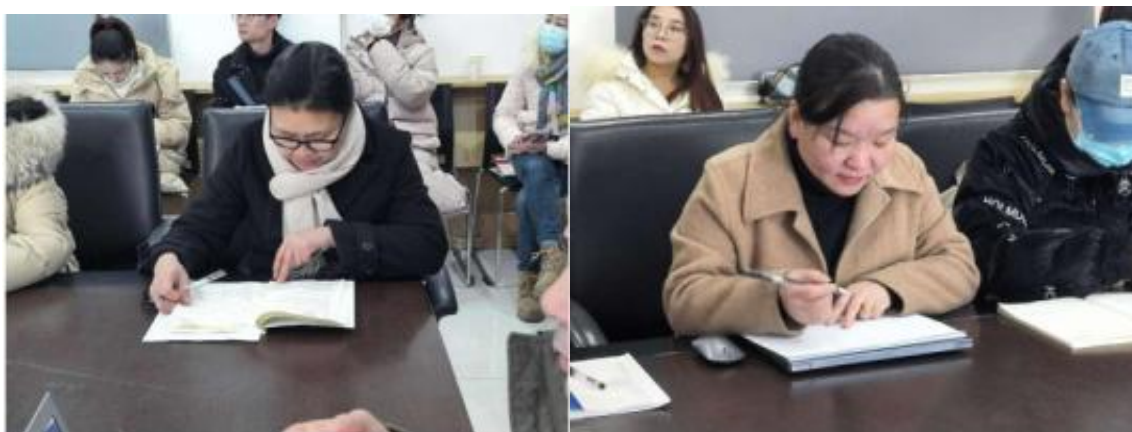
图3 中期答辩工作会议现场2

各专业负责人对中期答辩评审注意事项进行了补充，要求答辩评审教师重点关注学生对毕业设计的背景、目的、方法和预期结果是否有清晰的理解，检查学生的文献综述和相关研究进展是否充分，评估学生的研究设计是否合理、可行和创新；关注学生的实验设计和数据采集方法是否科学可靠；考察学生对研究结果的初步分析和结论是否合理；针对学生研究方向和方法提供建设性意见和指导。