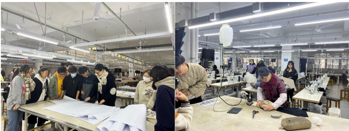
图8 清河工艺机房授课现场

本月学院督导巡课听课重点为实践课和参加课程评估的课程，针对教师教学态度与素养、教学内容、教学方法和教学效果等方面进行督查。