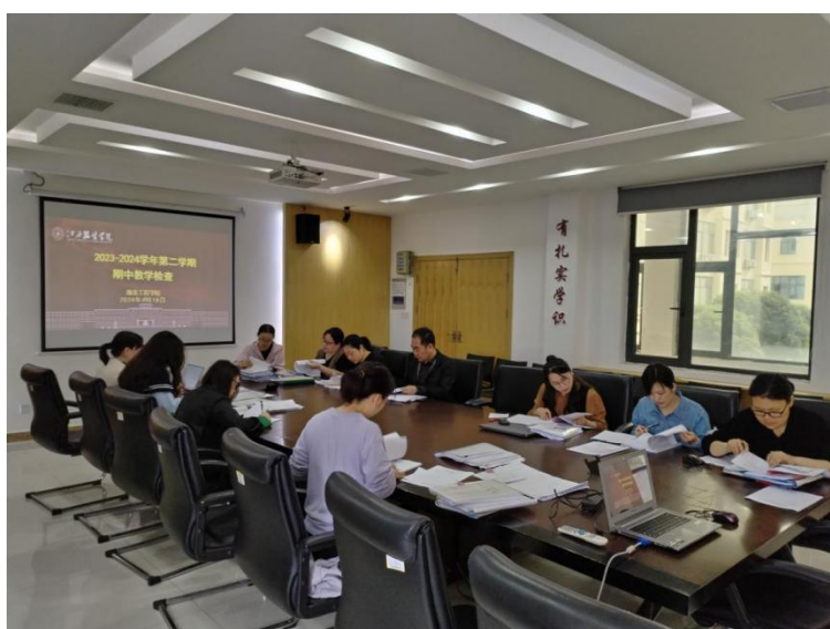
图7 期中教学检查现场

本次期中教学检查分为两个阶段开展，第一阶段为教研室自查，第二阶段由院领导带队、教研室交叉检查，针对前期教研室的自查整改情况进行复查。针对检查过程中发现的问题要求各检查组及时填写检查反馈通知单，同时将检查反馈通知反馈单下发给教师，要求教师在规定时间内进行整改反馈，并填写整改落实情况单，学院再针对落实情况进行复核，从而形成有效的教学质量监控闭环。