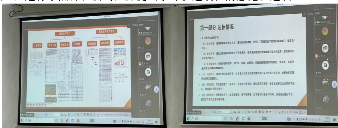
图6 课程负责人汇报

随后，参评课程负责人针对课程目标与定位、教师队伍、课程资源、教学实施、教学效果和课程特色等6个方面依次进行汇报。评委们认真听取了汇报，参照课程评估指标体系和评分标准，在参评课程自评报告的基础上，进行了点评和质询，并提出了许多建设性的意见和建议。